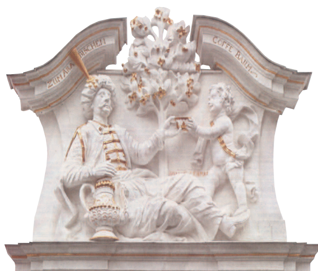
In dem Restaurant "Kaffeebaum" in Leipzig kann man noch heute diese in Stein gehauene Figur sehen, die einen Kaffee trinkenden Türken mit einem Engel zeigt.