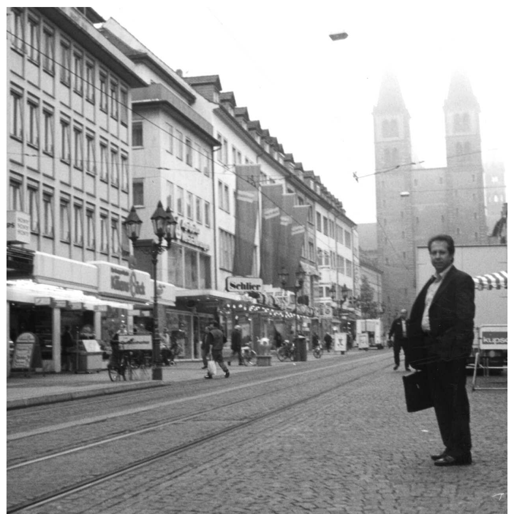
An dem Ort, an dem Karakoyunlu Mehmet Sadullah Pascha 1697 Würzburgs erstes Kaffeehaus eröffnete und den Kaffee auf einem Teppich sitzend servierte, befindet sich heute überraschenderweise eine Bäckerei, in der Kaffee getrunken wird.