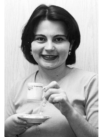
Den zeitgenössischen Dokumenten zufolge war der Kaffee schon von Anfang an bei den Frauen beliebter als bei den Männern. Besonders den Damen schmeckte der Kaffee nach der Zugabe eines süßenden Sirups.